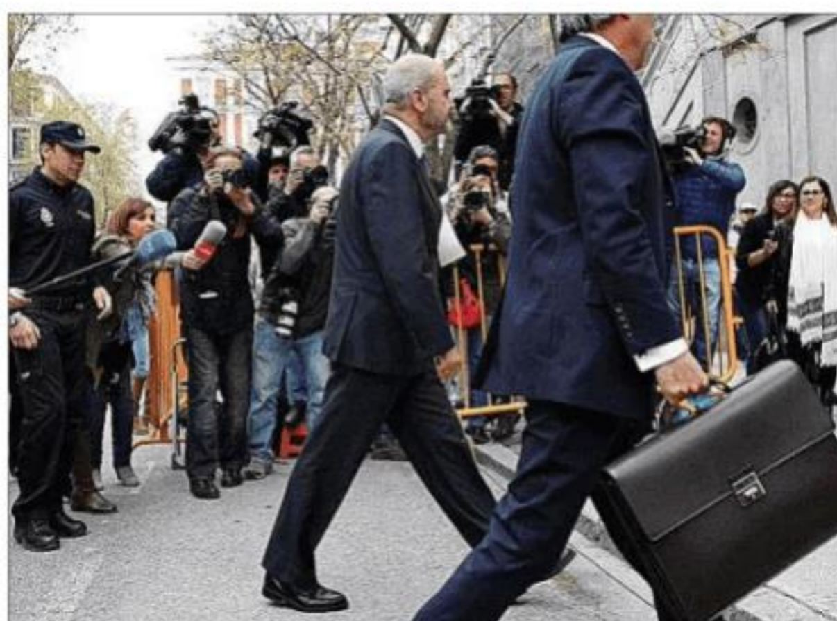
El ex presidente andaluz Manuel Chaves, en el Supremo por los ERE.

cenas renunció a su acta de senador, lo que supuso que perdiera el aforamiento y que la investigación del caso Gürtel se mantuviera entonces en la Audiencia Nacional.