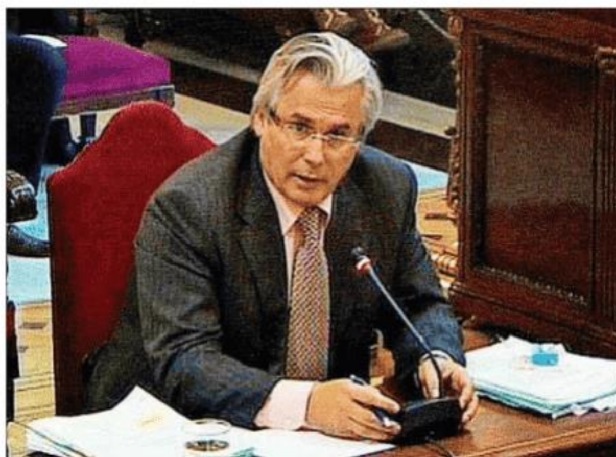
El juez Baltasar Garzón, en el Supremo por escuchas sobre la Gürtel. E.M.