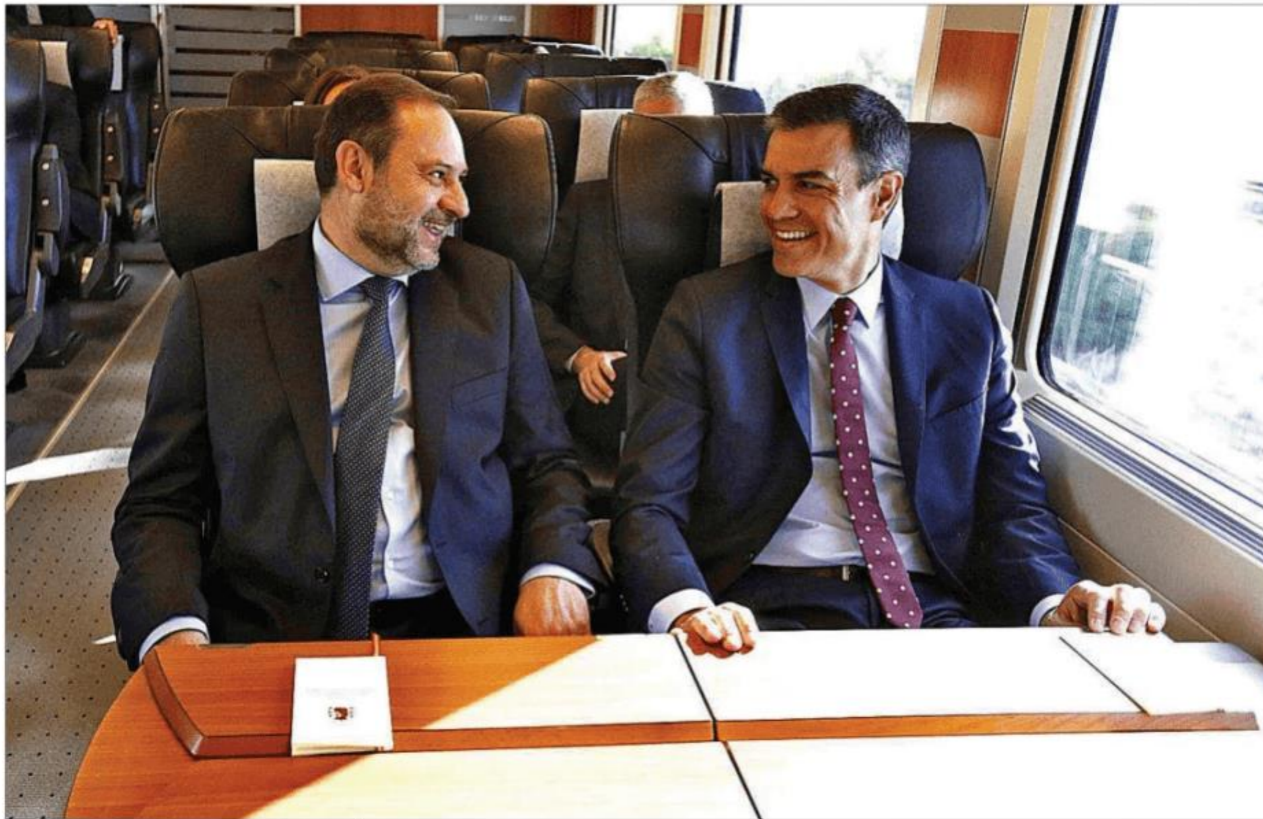
El ex ministro de Transportes, José Luis Ábalos, y el presidente del Gobierno, Pedro Sánchez, en un AVE entre Madrid y Granada.

EL TODOPODEROSO DE SÁNCHEZ, ANTE EL SUPREMO