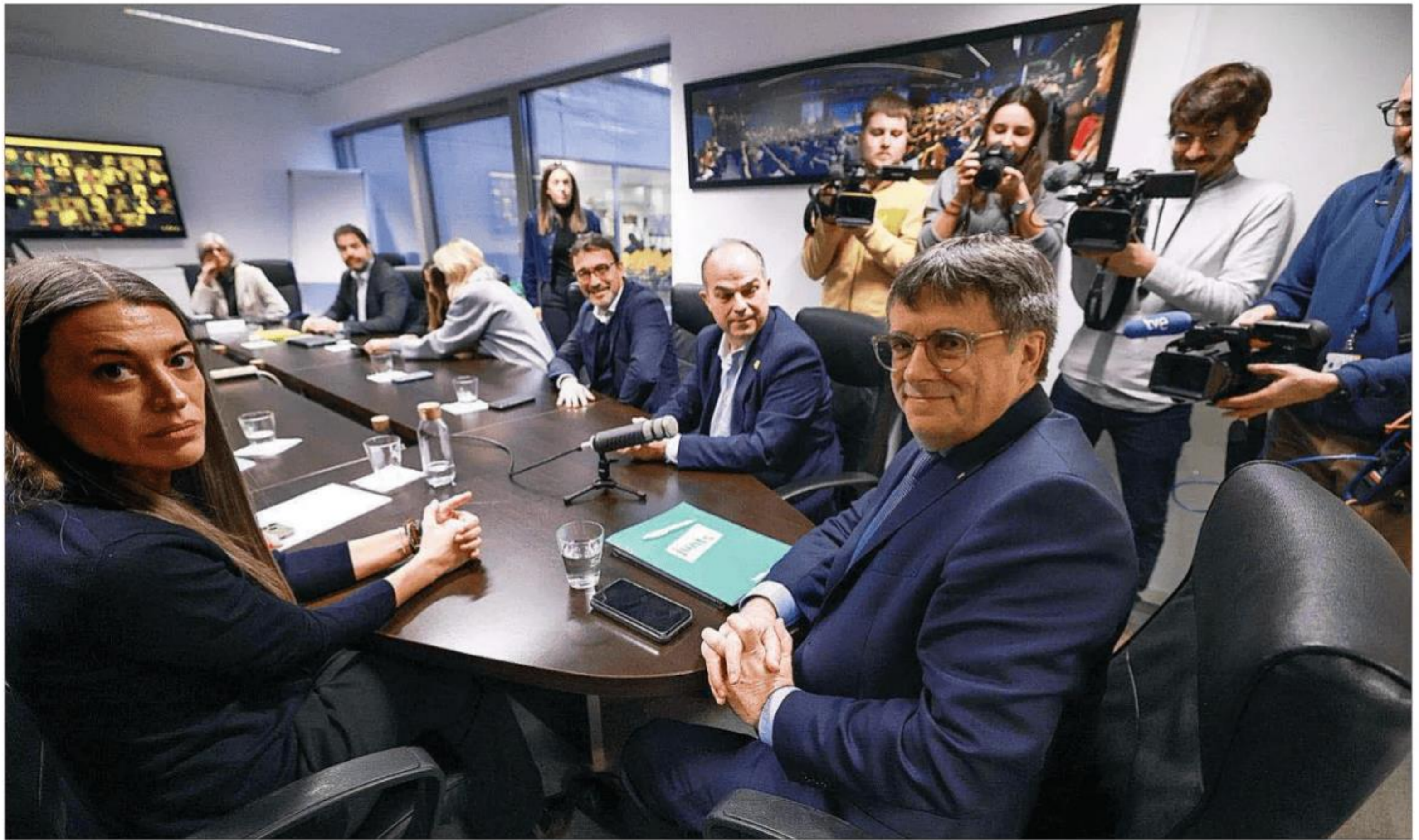
Carles Puigdemont (centro), junto a la portavoz de Junts, Míriam Nogueras, en una reunión del partido en Bruselas el pasado lunes.