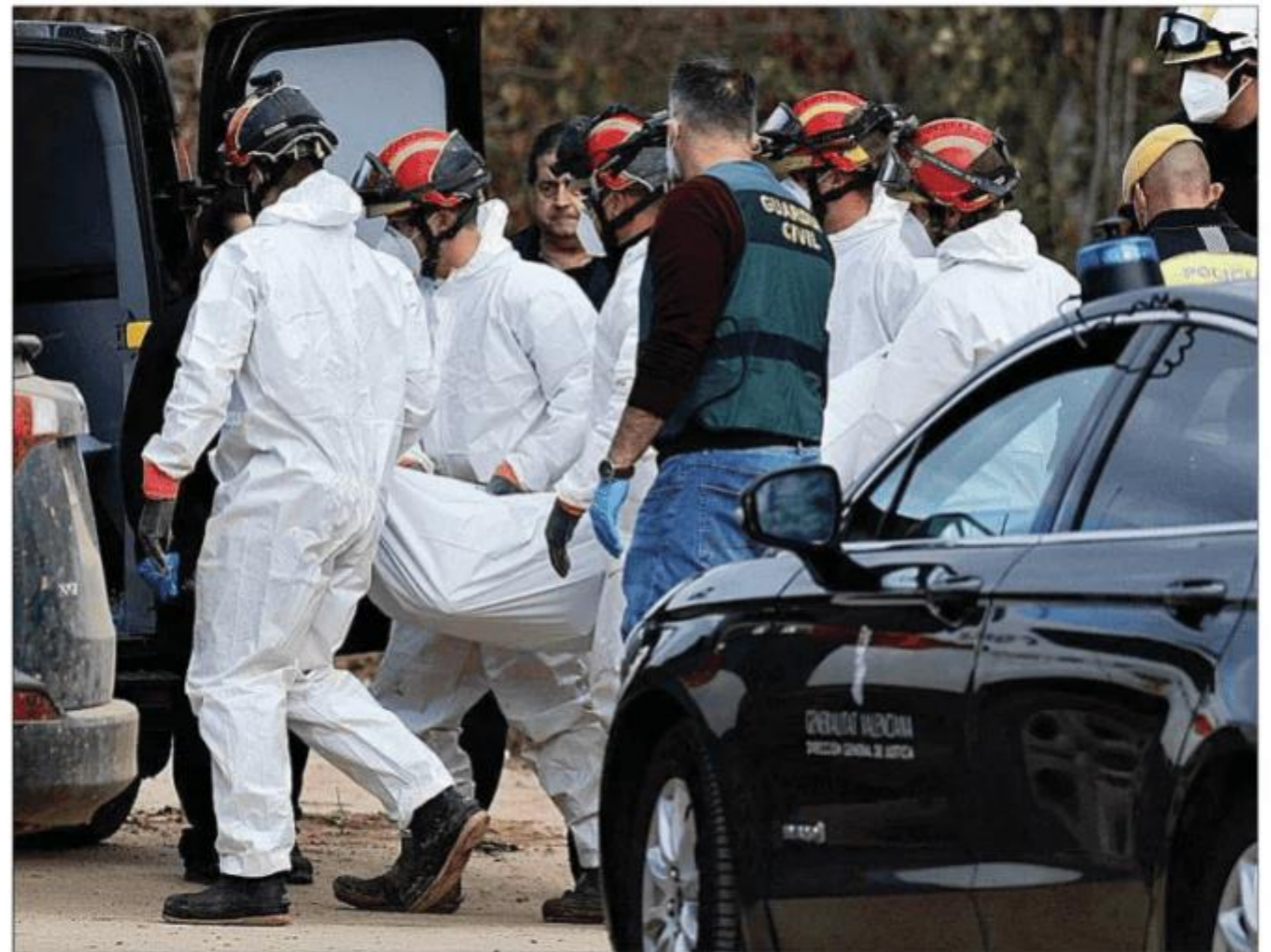
Efectivos de las Fuerzas Armadas trasladan el cadáver hallado ayer en Paiporta.

Vox arremetió contra el PSOE por apoyar una ley auspiciada por «filoetarras, golpistas y gentuza». El PP la bautizó como «ley Otegi» y afeó a los socialistas que la hayan pactado con Bildu para «mantener a Sánchez en el poder». El PSOE se defendió tachando a los populares de «regresivos» y reprochándoles querer «silenciar a la gente». Sumar definió a la oposición como los «novios de la muerte» y Podemos aprovechó para arremeter contra los jueces «corruptos» citando a los magistrados Concha Espejel, Carmen Lamela, Pablo Llarena, Manuel Marchena y Manuel García Castellón.