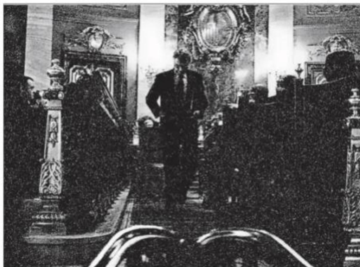
Felipe González declara ante el Supremo por el caso de los GAL.