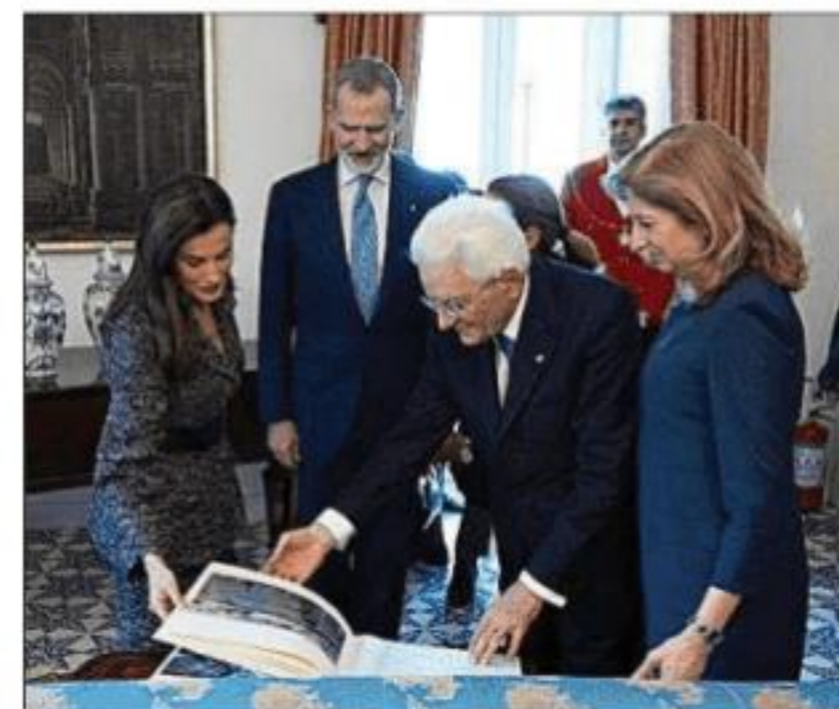
Felipe VI durante su viaje de Estado a Italia.

Al tiempo que José Manuel Albares ejecutaba la vendetta , el