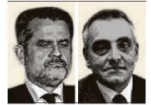
M. Á. FDEZ.-PALACIOS / GIUSEPPE BUCCINO

La iniciativa del PP –de la que es impulsora– para que el Congreso reclame al Gobierno la solicitud al Tribunal Penal Internacional (TPI) de la detención de Nicolás Maduro prosperó ayer pese al voto en contra del PSOE. Una reclamación de justicia tras el fraude electoral y la dura represión del régimen venezolano.