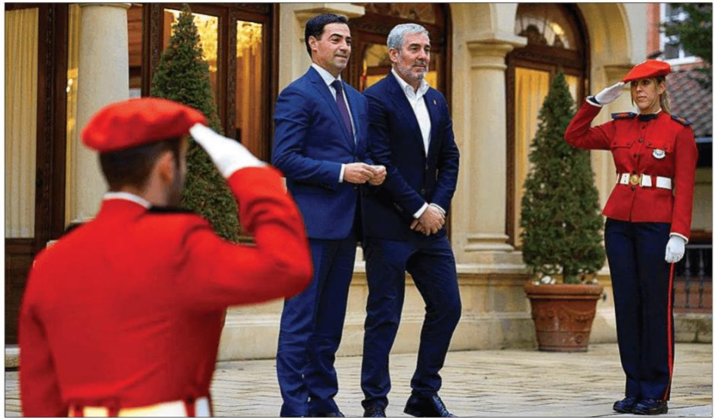
El 'lehendakari', Imanol Pradales, posa junto al presidente canario, Fernando Clavijo, en las escalinatas del palacio de Ajuria Enea en Vitoria.

Buruaga, que como anfitriona ha preparado a conciencia la cita con sus correligionarios, definió ayer el sentir de las autonomías y las dos ciudades autónomas presididas por el PP: «Salvo el presidente Sánchez y Salvador Illa, todos estamos de acuerdo en rechazar la financiación a la carta