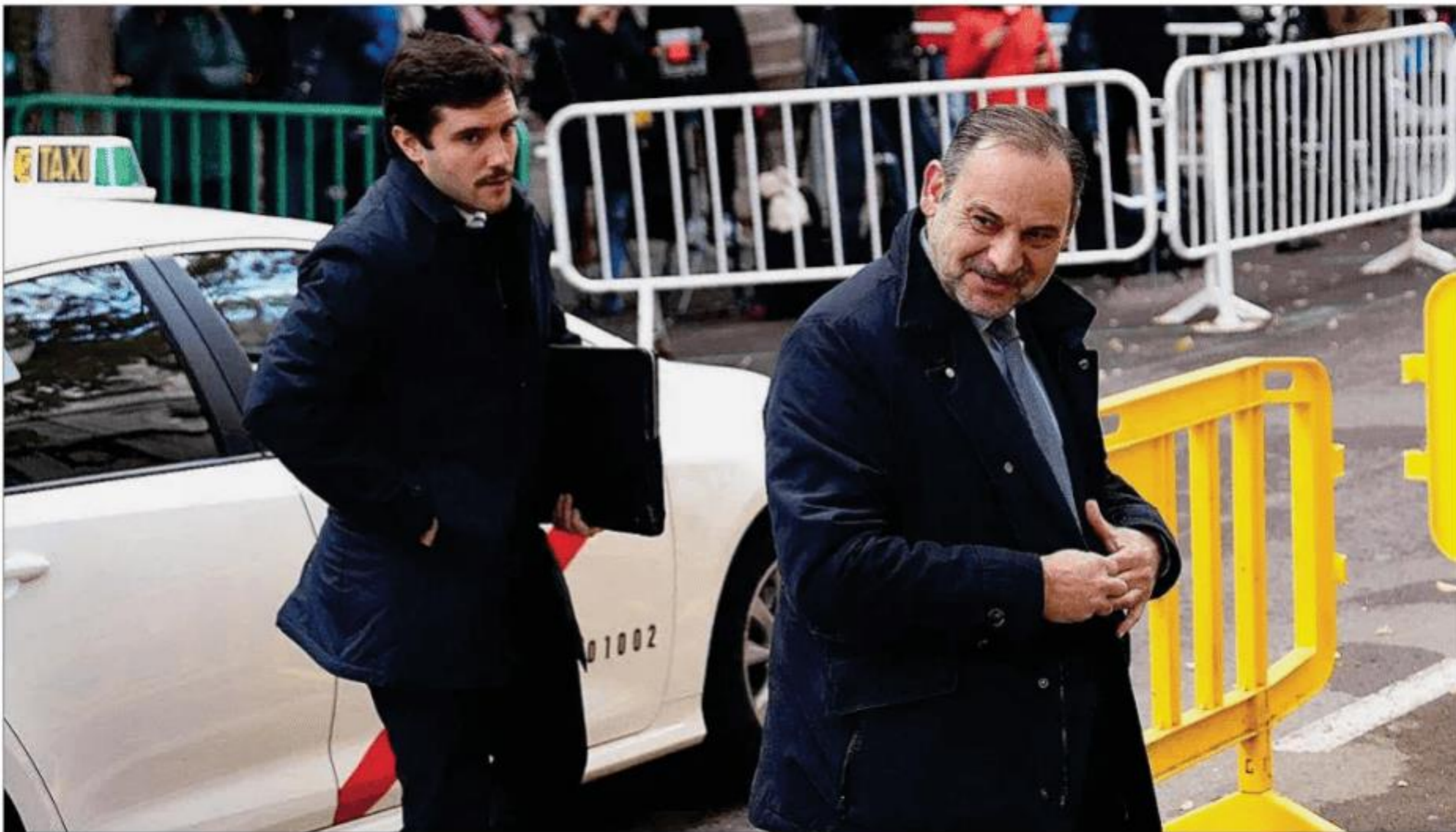
El ex ministro de Transportes José Luis Ábalos, a su llegada ayer al Tribunal Supremo para declarar por el 'caso Koldo'.