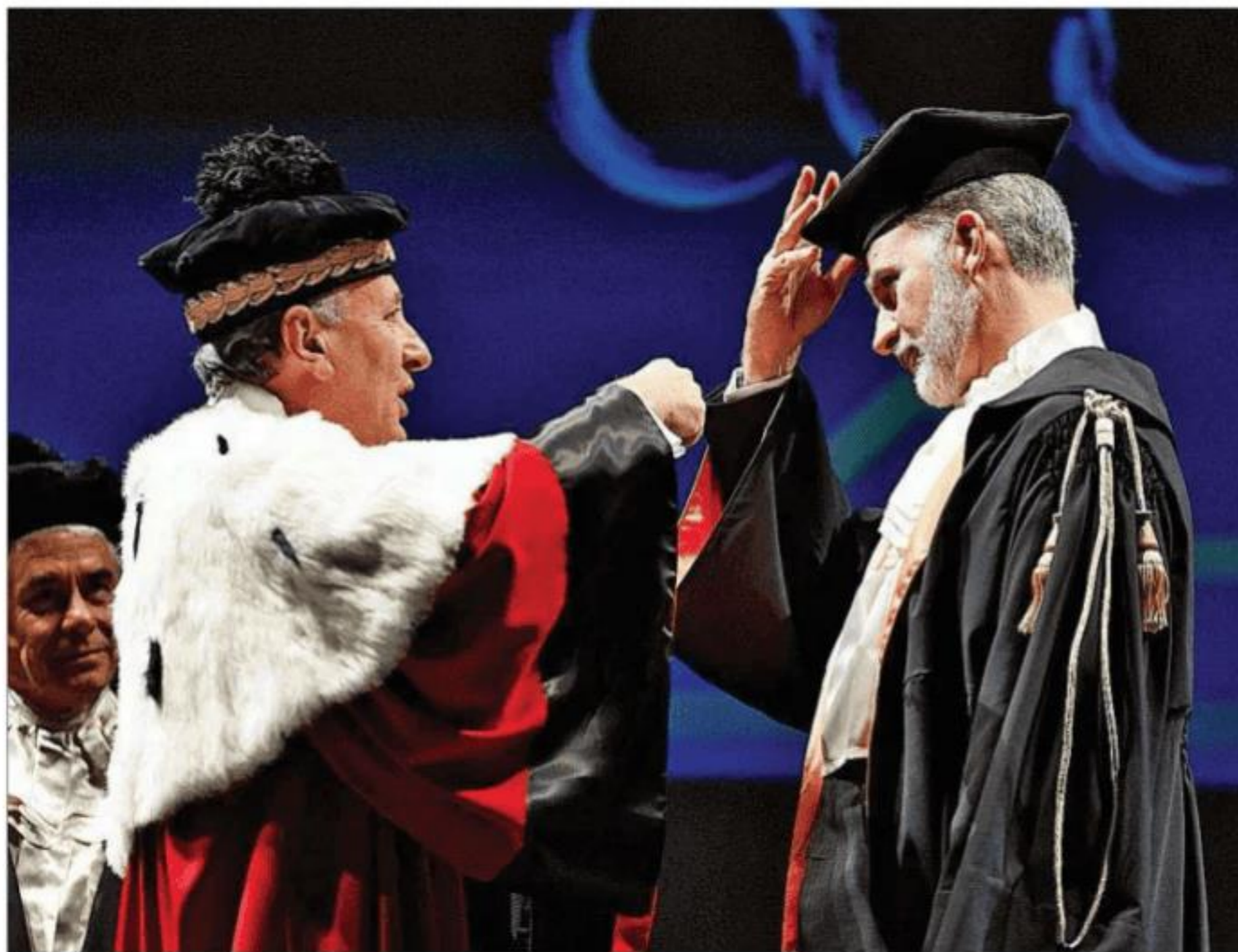
El Rey, en el acto en que fue nombrado doctor Honoris Causa por la Universidad Federico II de Nápoles.